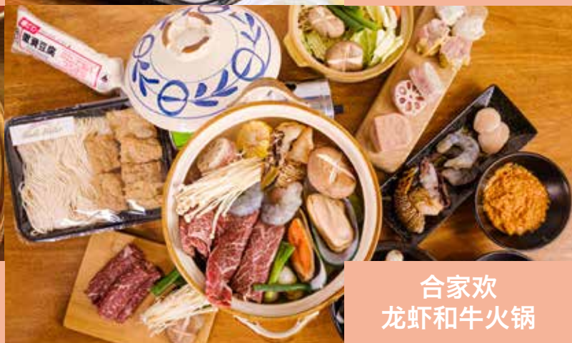
合家欢 龙虾和牛火锅